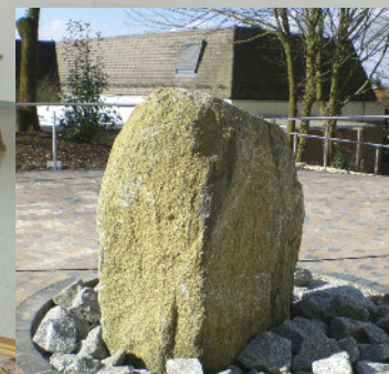
Gestaltung des Wohnumfeldes